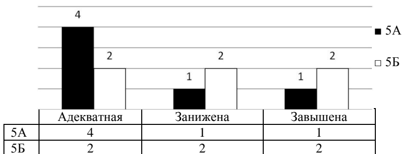
Рис. 1. Уровень самооценки (по методике О. С. Богдановой «Какой я?»)

Для исследования уровня развития личностных УУД была использована модификация методики О. С. Богдановой «Какой я?». Цель данной методики — выявить уровень осознанности нравственных категорий и адекватности оценки наличия у себя нравственных качеств. По результатам с учетом наблюдений и психолого-педагогической характеристики можно судить об уровне развития личностных УУД, поскольку самооценка является одним из таких учебных действий. На рисунке 1 представлены результаты исследования уровня самооценки у обучающихся в экспериментальной и контрольной группе.