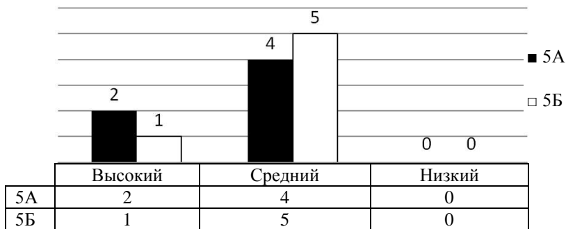
Рис. 3. Уровень развития познавательных логических и знаково-символических действий (по методике А. Н. Рябинкиной «Нахождение схем к задачам»)

На рисунке 3 представлены результаты исследования уровня развития познавательных логических и знаково-символических действий ребенка в экспериментальной и контрольной группе.